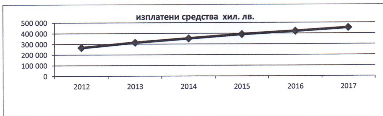
Диаграма 2 Динамика по години на изплатените средства за временна неработоспособност (в хил.лв.)